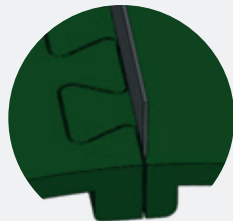
Traditional Jig-saw joint (<50% support)