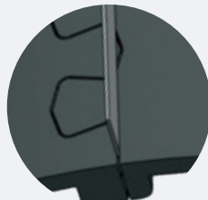
Rodicut Full-cut joint (>75% support)