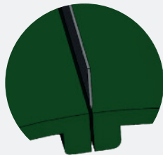
Straight joint (0% support)

Comparativa posibilidad de coincidencia cuchillas usando: