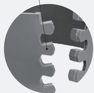
Efficient joint geometry